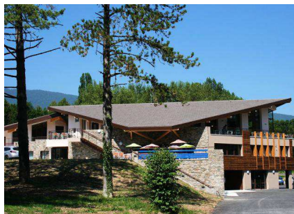
Le Village Vacances Ternélia de St Jorioz

Restitution musicale de clôture : 29 septembre à 21h