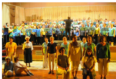
Restitution musicale du stage, chœur fixe et groupe « mise en scène »

La participation à la mise en scène des chansons est facultative, une certaine aisance scénique étant requise.