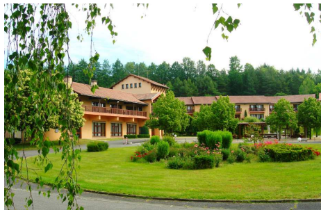
Village Vacances « La Châtaigneraie »

Programme des journées : 6 à 7 heures de travail musical par jour.