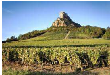
Une semaine chantante au cœur du vignoble mâconnais

Prestations de qualité hôtelière : salle de bain et toilettes dans chaque chambre, TV et connexion wifi gratuite, draps et linge de toilette fournis. Accès à la piscine de l'hôtel pour les formules C & D. Repas sous forme de buffets, vin et café inclus.