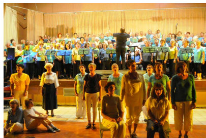
Restitution musicale du stage, chœur fixe et groupe « mise en scène »

La participation à la mise en scène des chansons est facultative, une certaine aisance scénique étant requise.